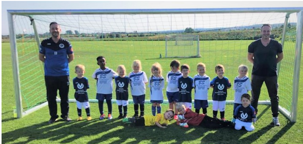
Testspiel der Bambini-Mannschaft am 19.09.2020 in Billig